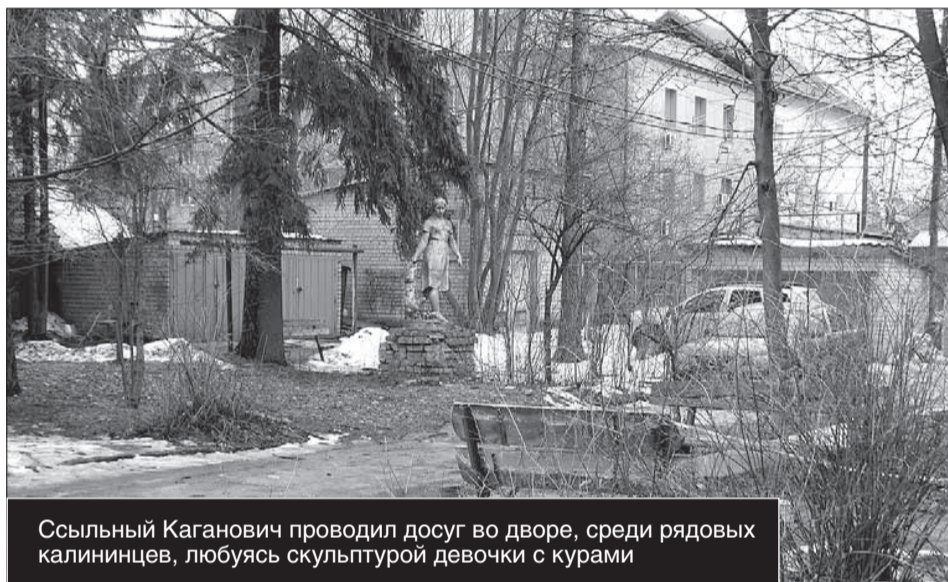
Ссылный Каганович проводил досуг во дворе, среди рядовых калининцев, любясь скульптурой девочки с курами

Современная Тверь, Заволжский район в той его части, что принято называть тихой – улицы Мусоргского, Павлова, Конопляниковой, Карпинского, переулки, бульвар Шмидта. Застройка этого района велась в послевоенное время домами одного стиля. Наверное, в свое время это был очень привлекательный жилой массив, ныне же он смотрится запущенным. Стоит прогуляться по нему и полюбоваться его неявной красотой. Тем более, что ваша прогулка, скорее всего, пройдет по маршруту, по которому