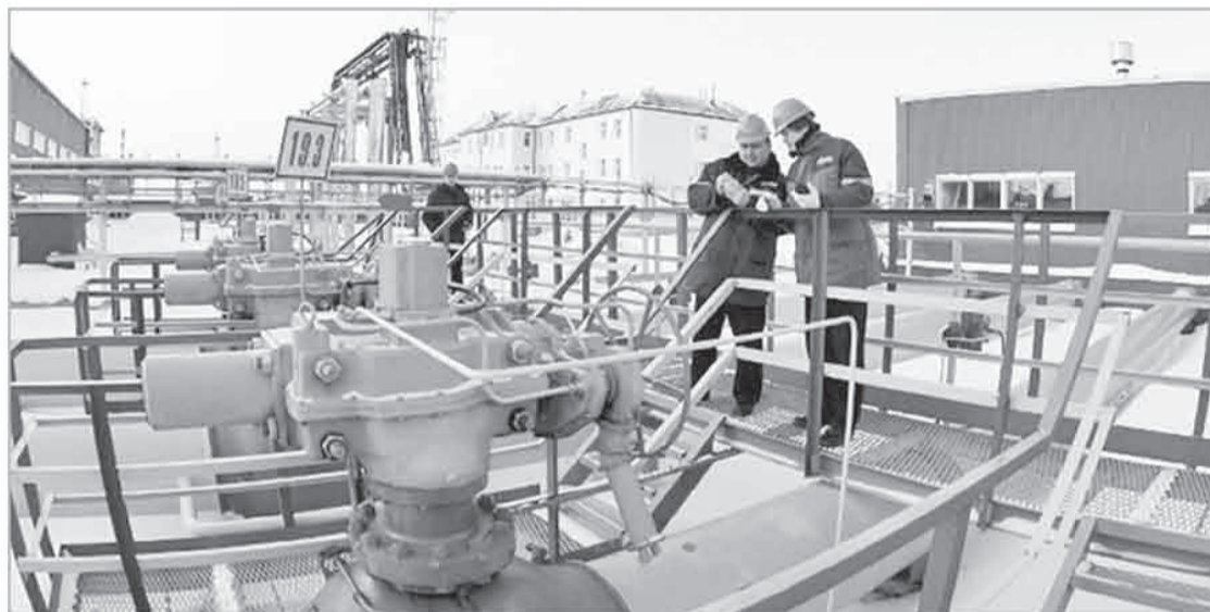
Правительство области намерено обеспечить выполнение плана-графика работ в рамках реализации программы развития газоснабжения и газификации на период с 2016 по 2020 годы

В некоторых муниципалитетах их устраивают по-прежнему: с музыкой и культурно-развлекательной программой. Но даже если ярмарочная торговля не сопровождается шумными представлениями, она все равно приносит удовлетворение и покупателям, и продавцам. Первым – потому что есть возможность получить свежие продукты с уверенностью в том, что в их составе не прячутся химические добавки, а в цене нет накруток посред-