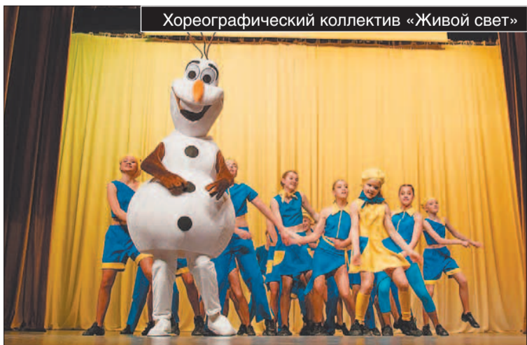
Хореографический коллектив «Живой свет»

звука и света безнадежно устарела. Еще бы, она ведь закупалась в семидесятых. Договорился с москвичами, которые уже открыли у нас бар. Пришлось, правда, сдать еще часть площади под игровые автоматы. Но они привезли 20 кВт аппаратуры звука! Плюс усилители и ударные установки. И еще подарили автобус. Ничего подобного в Твери тогда не было. Со светом проблему решил подобным же образом. Стал сотрудничать с фирмой «Лайфстар». На то время монополисты по свету. На всех концертах в городе свет устанавливали они. В их распоряжении оказался карман сцены. А в 1991 году приютил «Лигу». И тоже вполне целенаправленно. Нашим коллективам требовались фонограммы и