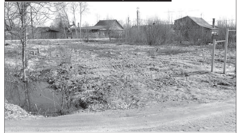
На этом месте может быть спортплощадка