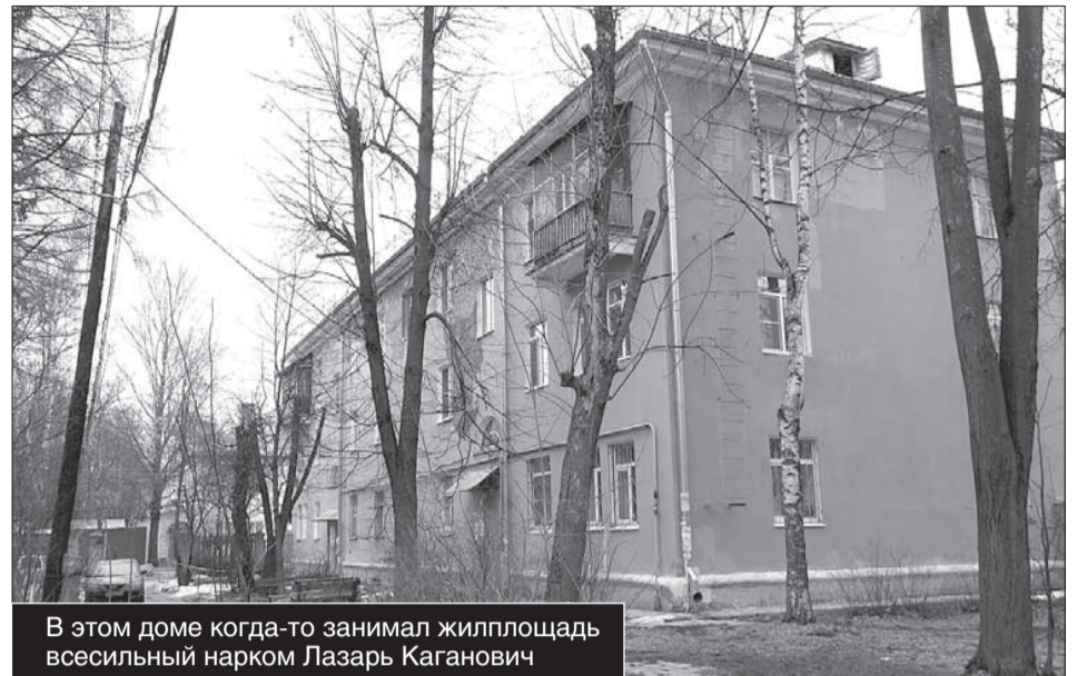
В этом доме когда-то занимал жилплощадь всеизвестный нарком Лазарь Каганович

Лазарь Каганович примкнул к большевикам еще в юные годы и быстро двигался по карьерной лестнице. В 30-е годы XX века он прочно занял место в высшем эшелоне власти Советского государства. Разумеется, долгие годы являлся членом Политбюро ЦК КПСС – самого узкого сообщества советских vip-персон. Руководил Украинской ССР в ранге первого секретаря ее партийной организации – Порошенко и Янукович того времени! С 1935 года – народный комиссар (министр) путей сообщения. Поезда при Кагановиче ходили точно по часам. Руководил постройкой Московского метрополитена, отчего целых двадцать лет – с 1935 по 1955 годы столичное метро носило его имя. Станция Охотный Ряд в то время тоже была имени Кагановича. Троллей-