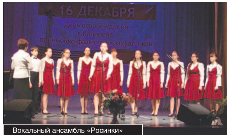
Вокальный ансамбль «Росинки»

— Да. Но мы не останавливаемся на достигнутом. Появились новые направления. Работа с инвалидами и ветеранами, благотворительные концерты. В про-